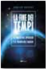
LA FINE DEI TEMPI Le profezie dell'Apocalisse e il trionfo dell'Agnello ADRIAN ROGERS ADI-Media