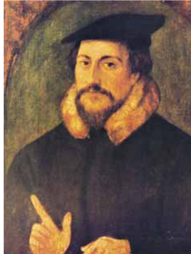
Giovanni Calvino (Jean Calvin - 1509-1564) pastore francese e teologo influyente durante la Riforma Protostante.

"A voi per primi", quindi, e non "per unici". Effettivamente Israele è stato prescelto, anche perché evidenziava, quale piccolo nucleo, non la propria forza militare, bensì la potenza e l'amore del Signore; tuttavia, esso non fu selezionato per essere l'unico popolo benedetto da Dio, ma per essere consacrato quale Suo testimone presso tutti i popoli della terra (Deuteronomio 7:7, 8).